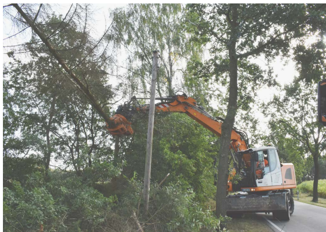
Der abgesägte Baum wird kontrolliert am Straßenrand abgelegt

Als Totholz bezeichnet man abgebrochene Äste, das Wurzelwerk gefällter Bäume, abgestorbene Bäume, stehendes und liegendes Totholz, aber auch alte und kranke Bäume. Wenn es notwendig ist, steht die Verkehrssicherheit über dem Erhalt der Totholzbäume, auch wenn von Totholz ein hoher ökologischer Wert ausgeht.