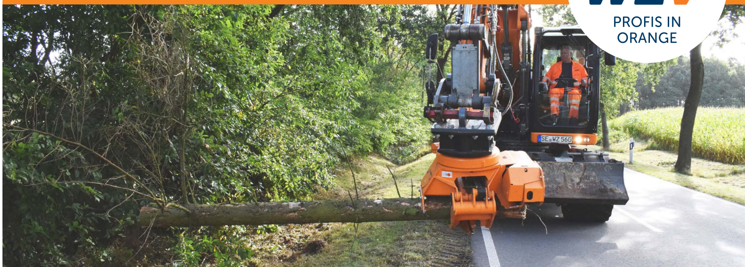
Der Fällgreifer mit Säge