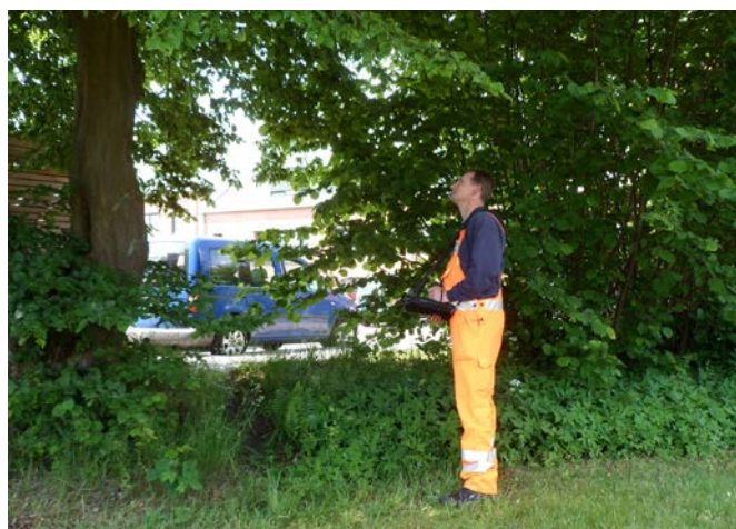
Wiederholungsprüfung zur Aktualisierung der Daten