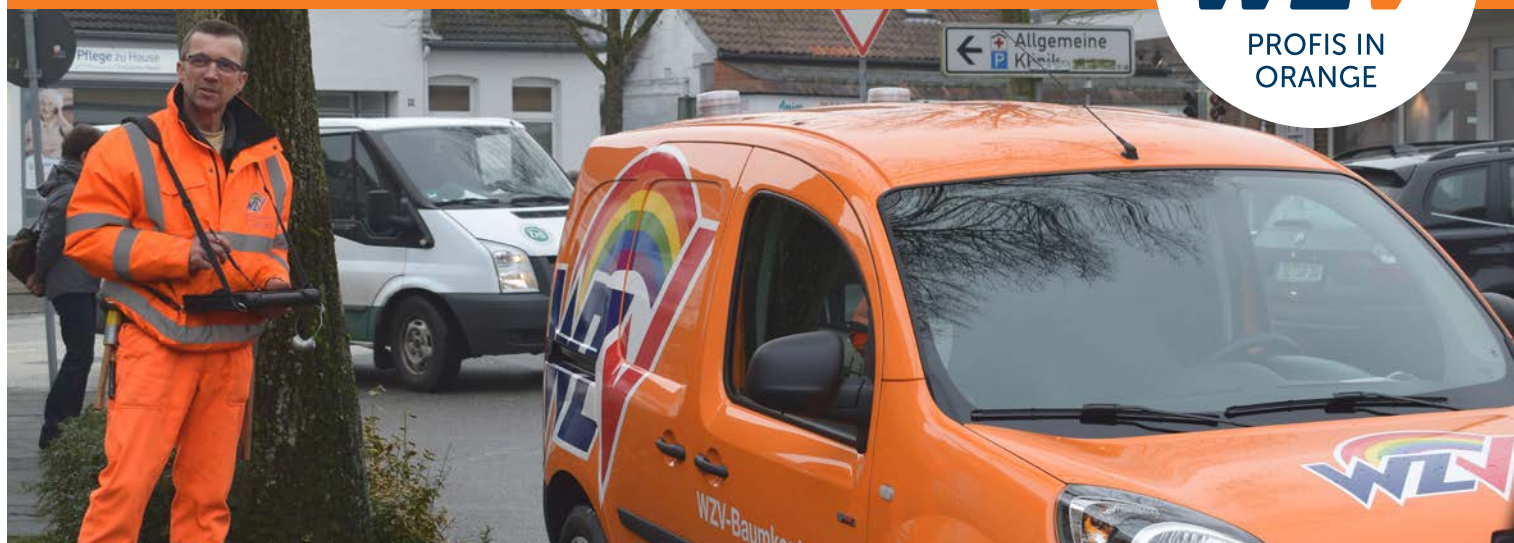
Baumkontrolleur Thomas Lensinger mit schadstofffreiem Einsatzwagen